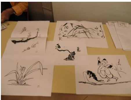
御手本。 夏なので、 ろくろ首、も。