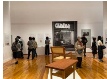
「アイノアルヴァ 二人のアルト」展会場