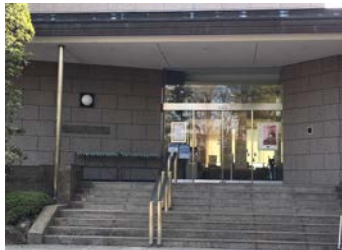
静嘉堂文庫美術館 入口