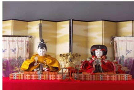
五世大木平蔵製「岩崎家雛人形」のうち内裏雛 昭和初期